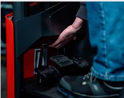
Mechanisch verstellbare Neigung der Pedalplatte