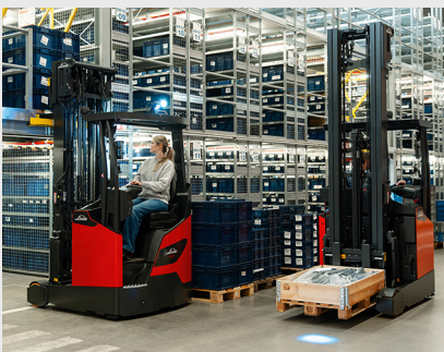
Müheloses und effizientes Lasthandling