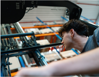
Panzer Glasdach für optimale Sicht