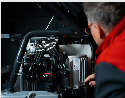
Schneller Zugang zu allen Servicebauteilen